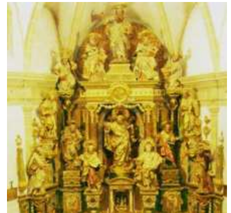
Retaule Barroc de Sant Pere de Matamargó (Solsonès)

Dissabte 14 de gener. Sortirem al matí, cap a les 9:15h en autocar i serem a casa cap a les 22:00h. Visitarem la Cova de Sant Ignasi de Lloiola a Manresa. Pujarem i dinarem a prop d'Ardèvol. Tindrem la Missa Dominical a l'església de Matamargó, amb un impressionant retaule barroc. A les 18:30h representació del Pessebre Vivent, i sopar de torrades amb botifarra. Si som 40 persones, ens sortirà un preu de 50€, tot inclòs (autocar, entrades, visites guiades i dinar). Reserveu la vostra plaça a la Sagristia, al Despatx Parroquial, o al correu electrònic parroquiacastellar@gmail.com .