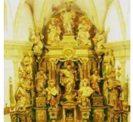
Retaule Barroc de Sant Pere de Matamargó (Solsonès)

Dissabte 14 de gener. Sortirem al matí, cap a les 9:15h en autocar i serem a casa cap a les 22:00h. Visitarem la Cova de Sant Ignasi de Lloiola a Manresa. Pujarem i dinarem a prop d'Ardèvol. Tindrem la Missa Dominical a l'església de Matamargó, amb un impressionant retaule barroc. A les 18:30h representació del Pessebre Vivent, i sopar de torrades amb botifarra. Si som 40 persones, ens sortirà un preu de 50€, tot inclòs (autocar, entrades, visites guiades i dinar). Reserveu la vostra plaça a la Sagristia, al Despatx Parroquial, o al correu electrònic parroquiastellar@gmail.com .